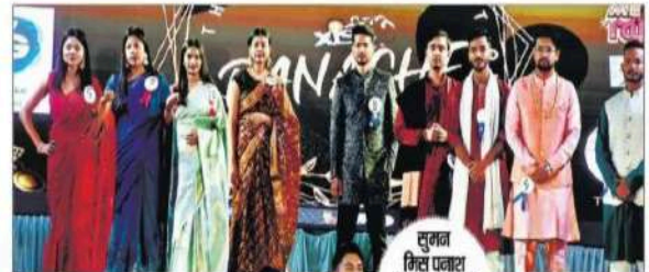
सहकारिपेरेटर @ रांची