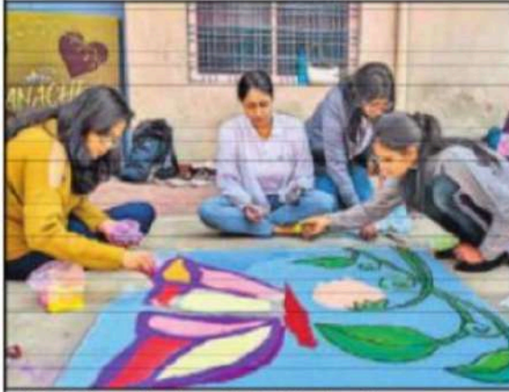
जेवियर इंस्टीट्यूट ऑफ सोशल सर्विस के दो दिवसीय वार्षिक उत्सव 'पनाश-2024' में शनिवार को कला प्रतियोगिता में प्रतिभा का प्रदर्शन करती छात्राएं।