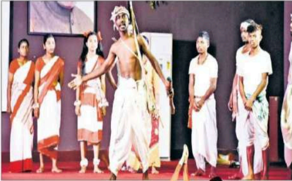
सहकारिपेरेटर @ रांची

रांची विश्व इंटर कॉलेज यूथ फेस्टिवल 'पनाश-2024' के दूसरे दिन रांची रजिस्टर को भी विभिन्न कॉलेजों के विद्यार्थियों का जलवा रहा. अर्धचंद्र राधाकर ने नाटक, माधव, मिमिक्की, पेंटिंग, मेकअप और इवेंट हुए. डोरंडा कॉलेज के विद्यार्थियों को टॉप ने न्याय पत्रिका का श्रेष्ठ कलाकारों के रूप में घोषित की।